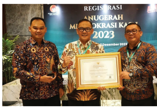
Capaian Sistem Merit Tahun 2023

Hasil penilaian sistem merit Tahun 2022, Pemerintah Kabupaten Bogor memperoleh kenaikan nilai menjadi 277,5 poin dengan kategori baik . Salah satu indikator yang menyebabkan meningkatnya perolehan nilai sistem merit Tahun 2022 adalah ditetapkan Peraturan Bupati Bogor tentang Pengelola Kinerja Pegawai ASN di Lingkungan Pemerintah Kabupaten Bogor.