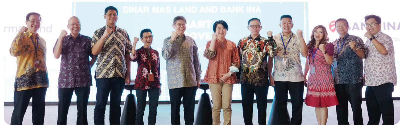
Jajaran manajemen Sinar Mas Land dan Bank INA berfoto bersama dalam acara penandatanganan memorandum of understanding (MoU) antara Sinar Mas Land dan Bank INA untuk program penjualan nasional Smart Move 2023.

Selain itu, ada Kota Wisata dan Legenda Wisata di Cibubur. Selanjutnya, Wisata Bukit Mas dan Klaska Residence di Surabaya, Nuvasa Bay di Batam, hingga Grand City Balikpapan di Kalimantan Timur juga ikut merayakan program ini. • vit